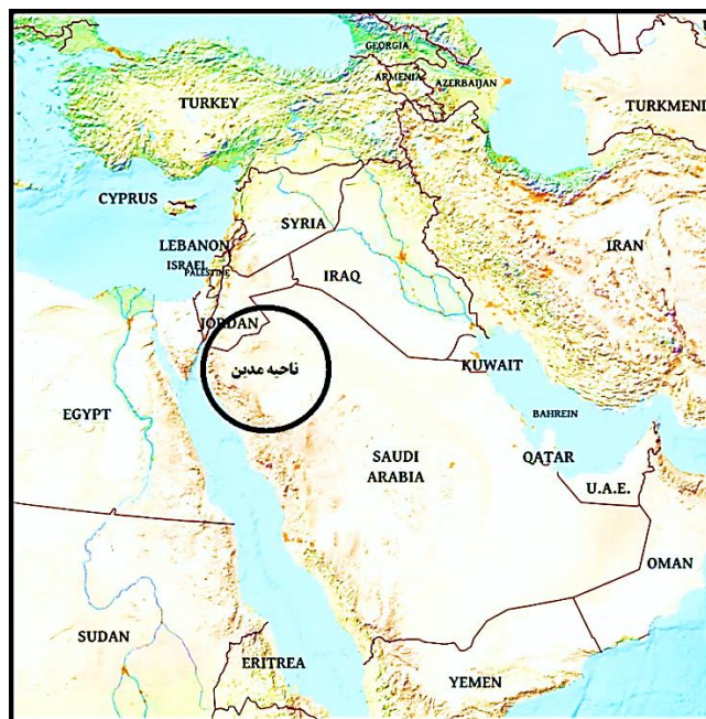
نقشه ۲: حدود تقریبی ناحیه مدین بر اساس مطالعات نگارندگان (Hubbard Scientific Raised Relief Map : Middle East)