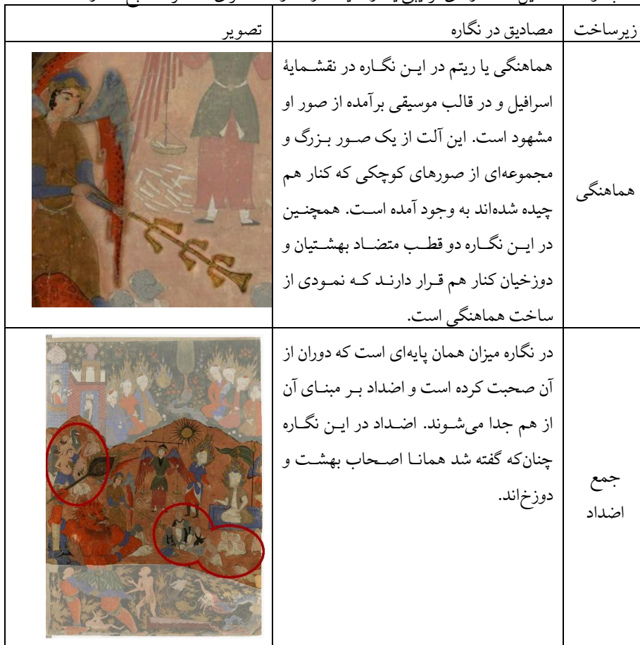
جدول (۳) تحلیل ساختارهای ترکیبی یا دراماتیک در نگاره «صحرای محشر» (منبع: نگارنده)

در سومین و آخرین بخش از این تحلیل به بررسی منظومه شبانه و ساختارهای ترکیبی یا دراماتیک در نگاره صحرای محشر پرداخته می‌شود.