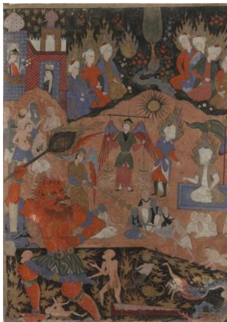
تصویر ۱) نگاره «صحرای محشر»، کتاب فالنامه طهماسبی، آبرنگ روی کاغذ.

نمونه مطالعاتی این نوشتار چنان‌که گذشت، نگاره «صحرای محشر» است. این نگاره که تصویر آن در ادامه آمده به بازنمایی صحنه داوری در روایت روز محشر پرداخته است.