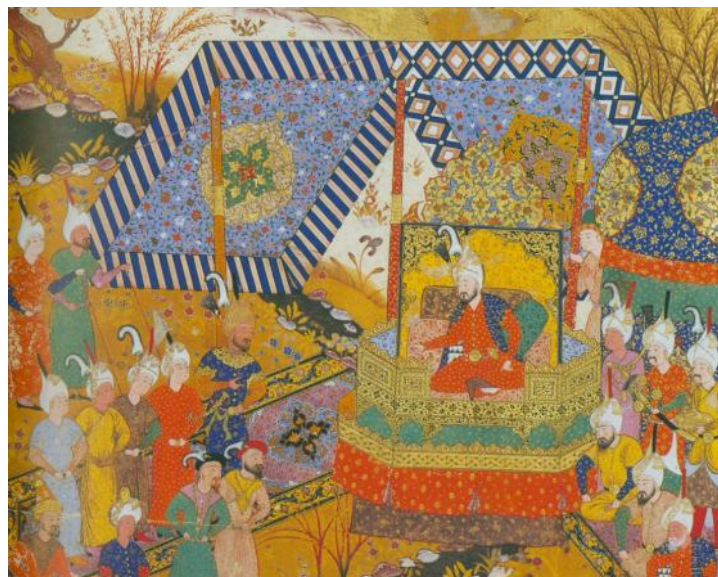
تصویر ۳: آوردن پسر سلطان مراد عثمانی در بز می نزد تیمور (رجبی، ۱۳۸۲: ۲۶).