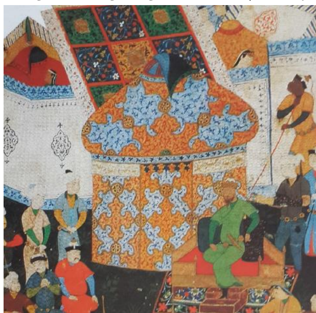
تصویر ۴: به تخت نشستن تیمور (سودآور، ۱۳۸۰: ۱۱۱).