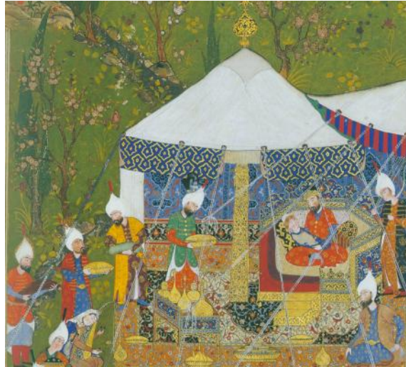
تصویر ۱: تفرجگاه تیمور در سمرقند (رجبی، ۱۳۸۲: ۲۲).