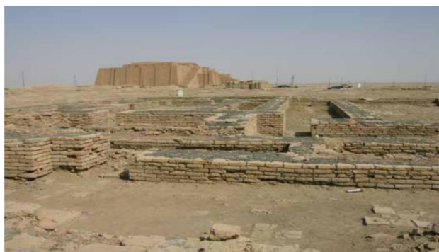
ویرانه‌های شهر اور، محل یکی از اولین موزه‌های جهان، متعلق به حدود ۵۳۰ سال قبل از میلاد مسیح.

کردند. توصیف‌ها و دستورالعمل‌های این فرآیند را از دوران باستان می‌یابیم. ۶۴ اما زمانی که به تاریخ هنر و تاریخ حفاظت و مرمت نظر می‌افکنیم تمایل به فعالیت خصوصی برای گردآوری هنر و به طبع آن، حفاظت و مرمت این آثار را به آغاز دوران رنسانس بازمی‌گردانند. ۶۵ نادیده گرفتن مجموعه‌هایی که توسط نخبگان مصر و بابلیان باستان ایجاد شده است، این دیدگاه را بسیار مشکوک می‌کند. در سال ۱۹۲۵ سرلئونارد وولی (۱۹۸۰-۱۹۵۲) مجموعه‌ای حیرت‌انگیز از آثار باستانی ۲۵۰۰ ساله را در حین کاوش در کاخ بابل که زمانی متعلق به پرنسس انیگدالدی-نانا ۶۶ که متصدی موزه و کاهن اعظم بود کشف کرد. این سایت در حقیقت یک سایت یادبود و علی‌رغم قدمتش نمونه‌ای بسیار پیشامدرن است. برخی از مجموعه‌های این موزه توسط پادشاه نبونیدوس، ۶۷ پدر شاهزاده خانم کاوش شده است و بسیاری از آثار باستانی آن متعلق به حدود ۲۰۰۰ سال قبل از میلاد مسیح، مدت‌ها قبل از ساخته شدن این موزه و ۲۵۰۰ سال پیش از اینکه این مکان توسط ووللی حفاری شود، است. ۶۸ شگفت‌آور است که آثار موجود در نمایشگاه موزه، توسط لوح‌های استوانه‌ای خشتی با شرح در سه زبان مختلف معرفی شده است. رویکردی چندزبانه که حتی امروزه هم بیشتر موزه‌ها نمی‌توانند خود را با آن تطبیق دهند. ۶۹