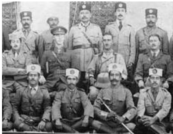
تصویر ۱۱- جمعی از نیروهای پلیس جنوب به فرماندهی افسران انگلیسی

الثانی ۱۳۴۴ق از سلطنت برکنار شد (مکی، ۴). این دوره را باید یکی از بحرانی‌ترین و خطرناک‌ترین ادوار تاریخ ایران دانست، زیرا در این دوره، استقلال کشور متزلزل شد. دورانی متلاطم و پر آشوب که همه چیز هم‌زمان سوخت و نابود شد بنابراین، از ارتش جز نامی و از نیروهای مسلح جز شبحی در سراسر کشور به جای نمانده بود (کاظمی، ۳۹). در این عصر نیز لباس قزاق‌ها همچنان مشابه قزاقان روسی بود (همان، ص ۴۱)؛ اما در رسته پلیس جنوب لباس نظامیان ایرانی کاملاً شبیه به لباس افسران انگلیسی تهیه شد. همچنان که در تصویر ۱۱ به چشم می‌خورد، تنها در کلاه و ملحقاتی نظیر نشان‌های روی کلاه و لباس متناسب با فرهنگ بومی ایرانی تفاوت وجود داشت.