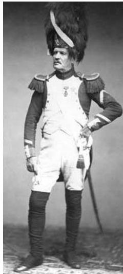
تصویر ۱- نظامی فرانسوی (۱۸۰۰م)، کتابخانه براون

تصویر توسط لوئیجی مونتابونه، عکاس هیئت ایتالیایی مأمور در ایران، در سال ۱۲۷۹ق/۱۲۴۱ش گرفته شده است.