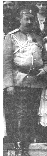
تصویر ۹- قزاق قفقازی

یک سفرنامه‌نویس آلمانی نیز به نوعی پوشش سرشش تن از نگاهبانان قذبلند محمدعلی‌شاه که دو طرف پله‌ها خبردار ایستاده بوده‌اند، اشاره کرده است. این پوشش کلاه‌خودهای پروسی با نوک تیز بود که یکی دیگر از سوغات‌های سفر فرنگ شمرده می‌شد (گروته، ۲۱۲).