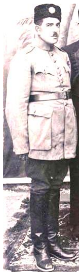
تصویر ۱۰- افسر ایرانی

پس از اندک زمانی طرح جدیدی از لباس قزاق‌ها باب شد. این لباس پیراهنی کوتاه بود با جلو سینه بسته، یقه لبه‌دار، چاک دکمه‌خور سمت چپ شانه و شلوار (نیم گالیفه) و چکمه، با کلاه پوستی و کمر بند باریک و دو چاک کوچک در پهلوها، با تغییر و تبدیلی مختصر در پارچه، دوخت، زیور سرآستین‌ها، لبه دامن و دور یقه‌ها به تناسب مناصب بالا و پستی مقام متفاوت بود (شهری، ۵۰۴/۲). در تصویر ۹، با بررسی جزئیات لباس نمونه دیگر قزاق قفقازی، در مقایسه با لباس سرتیپ فضل‌الله زاهدی فرمانده قوای فارس در تصویر ۱۰ پی می‌بریم که تأثیرپذیری طرح لباس قزاق قفقازی بر البسه نظامیان اواخر دوره قاجار تماماً اجرا شده است؛ با این تفاوت که افسر قفقازی کلاه کاسکت و افسر ایرانی کلاه پوست (کلاه ملی) بر سر دارند و پیراهن افسر ایرانی بلندتر از پیراهن افسر روسی است.