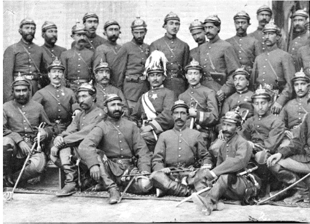
تصویر ۳- سربازان اتریشی، سایت کافه تاریخ