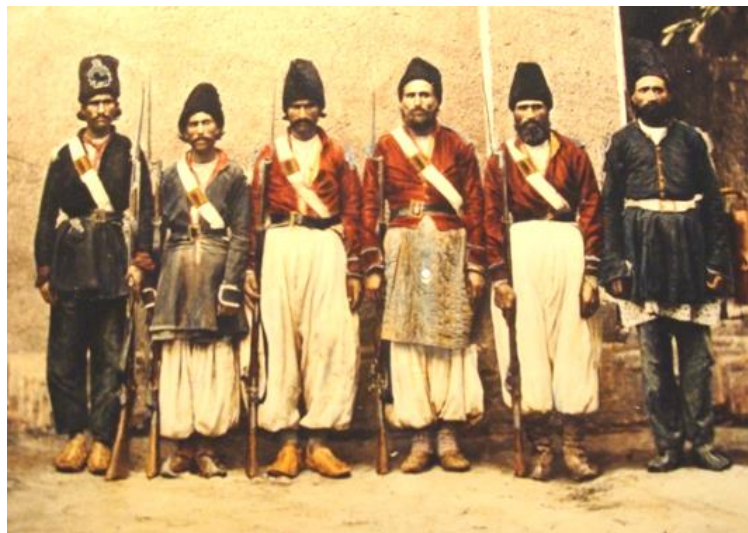
تصویر ۲- سربازان ایرانی، آلبوم خانه کاخ گلستان