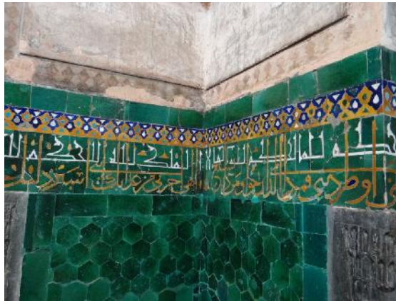
تصویر ۹: نمایی از دیوار گنبدخانه مسجد شاه

فضای داخلی گنبد با کاشی های سبز رنگ مستطیلی و شش ضلعی نفیسی پوشانده شده- است که از شاهکارهای دوره تیموری به شمار می رود. بر روی کاشی های سبز رنگ مستطیلی که قاب کتیبه ازاره را تشکیل داده، با آب طلا تزیین شده است. این نوع تزیین در مسجد سبز بورسه و در مسجد امام اصفهان نیز به کار رفته است. در وسط هر کاشی عبارت «علی» و ترنجی بزرگتر که عبارت «الحکم لله» را در بر گرفته، می توان مشاهده کرد. نمونه های این کاشی- های شش ضلعی سبز رنگ را می توان در مجتمع تومان آغا در شاه زنده، خانقاه شاهرخ در دامغان، مسجد سبز در بورسه، کلاه فرنگی باغ در افوشته و مسجد کبود تبریز مشاهده کرد. کتیبه اصلی بر روی ازاره شامل شانزده بیت از مناجات منظوم امیرالمؤمنین (ع) ۱۸ به خط ثلث کهربایی بر روی کاشی سبز رنگ نوشته شده که در قسمت فوقانی آن عبارت «الحکم لله و الملک لله» به خط کوفی مورق سفید تکرار شده است (تصویر ۹). مضمون این عبارات درخواست بخشش و آموزش گناهان از خالق یگانه است. این کتیبه و برخی از کتیبه های مدخل ورودی و عبارت «البقاء لله» در ساقه گنبد، موید آن است که این بنا به عنوان بنای چند منظوره نقش آرامگاه داشته است.