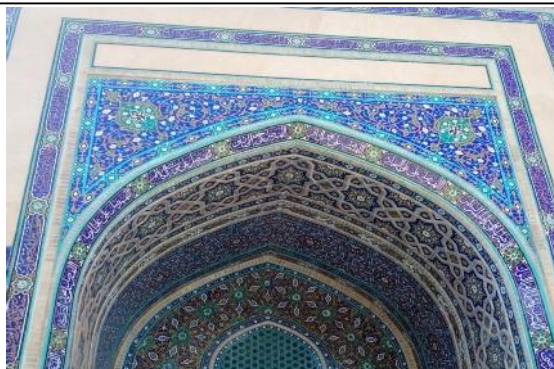
تصویر ۶: مدخل ورودی ایوان

در ضلع راست جدار مدخل اصلی در بالای قاب‌بندی تزئینی گلدان، به خط ثلث سفید بر زمینه لاجوردی نام معمار ۱۱ بنا حک شده و در بالای آن تنها عبارت «بسم الله» نمایان است و بقیه کتیبه از بین رفته است، به جز پایان کتیبه بر روی ضلع چپ که به نام بانی بنا و تاریخ ساخت ۱۲ آن اشاره دارد (تصویر ۷). البته همان‌گونه که در تصویر نیز مشاهده می‌شود بالای این کتیبه را خط کوفی به رنگ آبی روشن با سبکی مشابه سبک ایوان شرقی مدرسه پریزاد پر