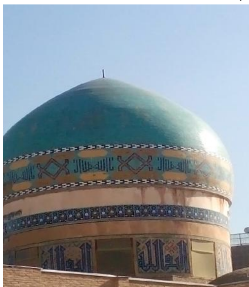
تصویر ۸: نمایی از گنبد و ساقه آن

بر دری که رو به گنبدخانه اصلی باز می‌شود، در مرکز نعل درگاه چوبی، ترنجی با عبارت «بسم‌الله» و تاریخ ۱۱۵۵ هجری مشاهده می‌شود. بر روی خود در نیز، چهار ترنج شامل کتیبه‌هایی به خط نستعلیق قابل مشاهده است. بر روی یکی از این ترنج‌ها احادیثی از رسول اکرم ۱۷ حک شده است که از سازندگان مساجد ستایش می‌کند. این کتیبه و کتیبه پیشانی ایوان تاکید بر نقش این بنا به عنوان مسجد است.