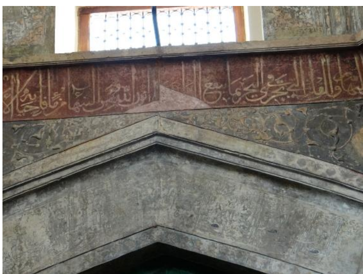
تصویر ۱۰: نمایی از گنبدخانه مسجد شاه

در چهار قوس گنبدخانه مسجد شاه بقایای کمی از کتیبه‌های نقاشی شده دیده می‌شود. با این وجود کتیبه نقاشی شده در زیر عرقچین گنبد با خط ثلث بر زمینه آلبالویی آیات ۱۶۶-۱۶۱ سوره بقره ۱۹ و تاریخ ۱۱۱۹ق نگاشته شده است (تصویر ۱۰) و بیانگر این است که این کتیبه‌ها در زمان شاه سلطان حسین صفوی (۱۱۰۵-۱۱۳۵ق) و هنگام مرمت مسجد نوشته شده است. مضمون این آیات تاکیدی بر توحید است.