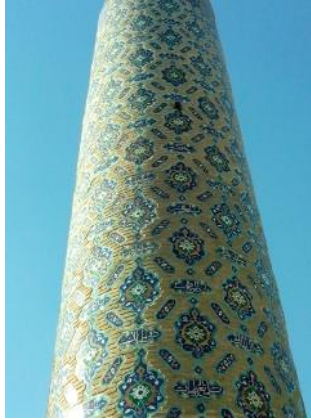
تصویر ۳: کتیبه اسماء الهی مناره

در بالای این افروز نیز اسماء الهی به خط ثلث سفید در داخل ترنج‌ها که برخی از آنها به صورت جفت‌جفت در اندازه‌های گوناگون نقش بسته‌اند، به چشم می‌خورند که می‌توان به «یا محیی یا ممیت» «یا صمد یا قادر»، «یا ناصر یا والی» و «یا رشید یا صبور» اشاره کرد (تصویر ۳). نمونه این ترنج‌ها در مناره‌های مسجد گوهرشاد نیز به کار رفته است.