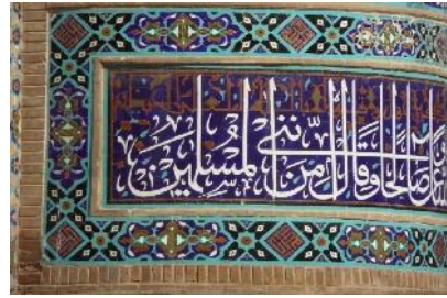
تصویر ۱: کتیبه بالای پایه مناره