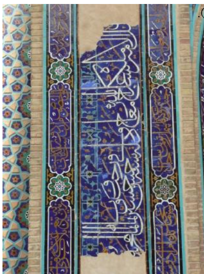
تصویر ۷: قسمتی از نمای مدخل ورودی