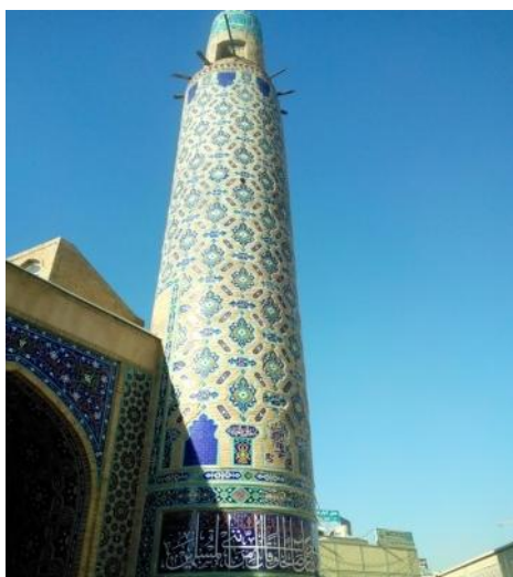
تصویر ۴: مناره سمت راست