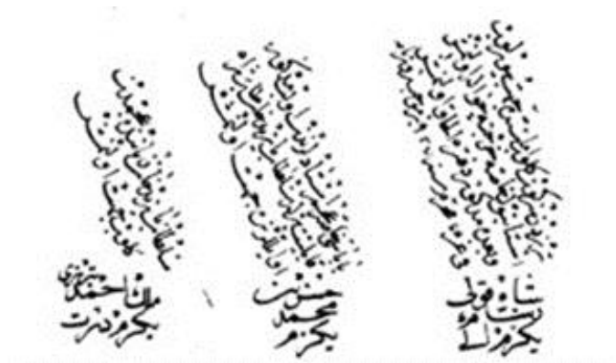
تصویر شماره ۱: بخشی از دفتر اهل حرف ۹۳۲ هجری

با به قدرت رسیدن شاه اسماعیل اول صفوی و به رسمیت شناختن مذهب شیعه، فشارهای بسیاری برای قبول آیین جدید بر اهل تسنن، که جمعیت کثیری از ایرانیان را شامل می‌شد، اعمال گردید. نحوه رفتار شاه اسماعیل با سنی مذهببان تبریز به هنگام فتح شهر که به دستور او تعدادی از اهل سنت به قتل رسیدند، شرایط نامساعدی را برای اهل تسنن به وجود آورد، که مهاجرت آنان را به کشورهای همسایه از جمله عثمانی، الزامی نمود (باربارو، ۲۲۱، ۲۵۱، ۳۱۰). در این برهه زمانی بسیاری از هنرمندان به میل و اختیار خود به سرزمین‌های همسایه در شرق و غرب کوچ نمودند. کتاب‌آرایان مشهوری همچون شاه قولی، حسین و احمد رومی از جمله این هنرمندانند که اسناد موجود شرح حال پیوستن ایشان را به دربار استانبول به اثبات می‌رسانند (تصویر شماره ۱).