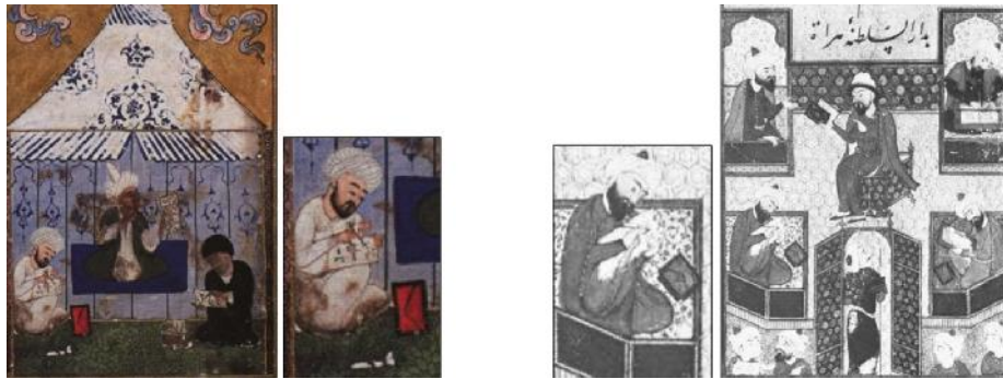
دیوان سلطان حسین بایقرا، هرات، ۸۹۷ هجری