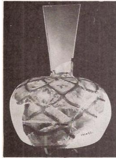
(۱) جام شیشه ای با تزئیناتی شبیه کندوی زنبور عسل (اوایل قرن ۴ ق)