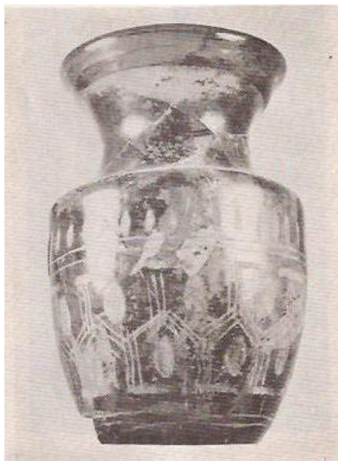
(۳) کوزه شیشه ای مزین با خطوط باریک به صورت پیچ در پیچ به رنگ خود ظرف (قرن ۵ ق) (۴) گلدان شیشه ای با حکاکی بر روی آن (قرن ۶ ق)