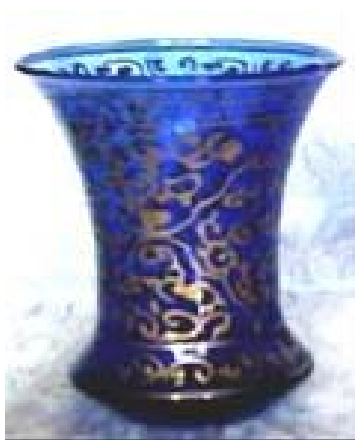
(۶) تزیین روی شیشه با رنگ‌های طلایی