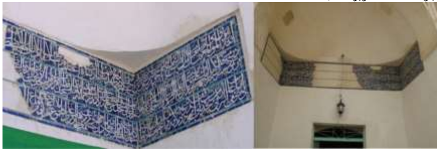
تصویر شماره ۲. کتیبه سردر مسجد بیرون در ابرکوه

مقبره، اکنون قبر طاوس الحرمین در داخل کتابخانه تکیه محله طاوس در منطقه نظامیه ابرکوه قرار دارد. این محله از قدیم الایام محل سکونت دراویش بود و امروز به محله درویش‌ها هم شهرت دارد. مزار طاوس اوقاف فراوانی داشت که در بقایای کتیبه سردر مسجد بیرون ابرکوه ۱ هنوز نام طاوسییه و برخی از اوقاف مشهود است ۲ (تصویر شماره ۲).