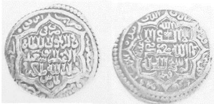
(علاءالدینی، سکه های ایران دوره ایلخانان مغول، ۳۰۱)

برگرفته و در میان آن‌ها عبارت «تبارک الذی بیده الملک و هو علی کل شیء قَدیر» ۱ نوشته شده و یک نشان حکومتی بر روی «اله» دیده می‌شود. در پشت سکه دو طرح شش ضلعی درون یکدیگر قرار دارند و در درون آن چنین نوشته شده است: «ضرب فی الدوله المولی السلطان الاعظم ابوسعید خلدالله ملکه طابوس». در حاشیه سکه چنین نوشته شده است: «ضرب ابرقوه فی سنة سبع عشر و سبعمائ» [۷۱۷ق].