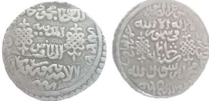
(علاءالدینی، سکه‌های ایران دوره گورکانیان، ۲۴)

سکه شماره ۴: این سکه در سال ۸۰۰ق ضرب شده و ۶/۱۸ گرم وزن و ۲۸/۲ میلی متر قطر دارد. عنوان محل ضرب «ضرب مدینه طاوس» است و از نظر طرح و نوشته با سکه دیگر که «ضرب ابرقوه» دارد، یکسان است. در روی سکه به ترتیب از بالا به پایین چنین نوشته شده است: «لا اله الا الله/ فی شهر ثمانمائه/ محمد رسول الله». در دو سمت نوشته‌ها دو نشان حکومتی نقر شده و اسامی خلفای راشدین برخلاف جهت حرکت عقربه‌های ساعت در حاشیه آمده است: «ابوبکر الصدیق/ عمر الفاروق/ عثمان ذی النورین/ علی المرتضی». در پشت سکه و درون دایره به ترتیب از بالا به پایین چنین نوشته شده است: «السلطان محمودخان المدینه الطاوس امیر تیمور گورکان». در حاشیه سکه چنین نوشته شده است: «فی شهر سنة ثمانمائه». دو نشان حکومتی نیز در دو سمت نوشته‌ها نقر شده است.