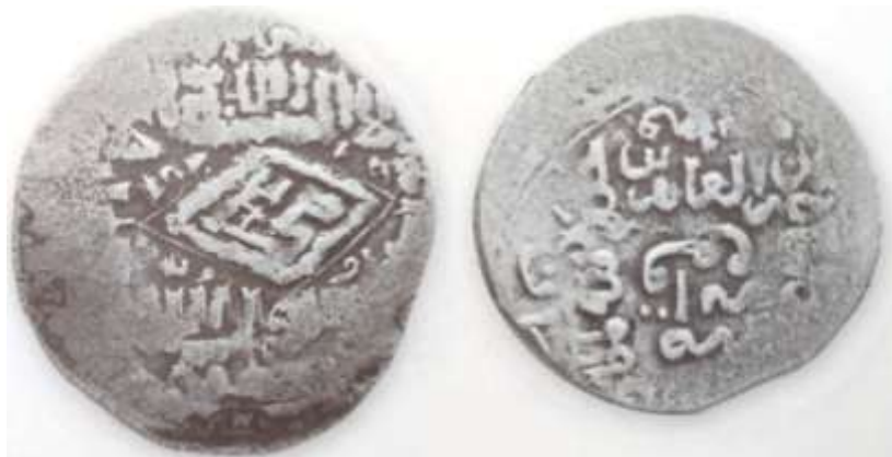
(علاءالدینی، سکه‌های ایران از انقراض ایلخانان مغول تا استیلای تیمور گورکان، ۱۶۰)

سکه شماره ۴: سکه‌ای از دوره زین العابدین مظفری (حک: ۷۸۶-۷۸۹ق) موجود است که ۱/۶۹ گرم وزن و ۲۰/۸ میلی متر قطر دارد. آسیب دیدگی طرح احتمالی روی سکه را از بین برده است. با وجود این، در مرکز نوشته‌ها از سمت راست به چپ چنین نوشته شده است: «زین العابدین خلد الله ملکه»، سپس از پایین به بالا مکان ضرب سکه آمده است: «ضرب ابرقوه». سال ضرب سکه در جهت حرکت عقربه‌های ساعت نقر شده است: «ثمان و ثمانین و سبعمائه». [۷۸۸ق]. در پشت سکه از بالا به پایین و به خط کوفی چنین نوشته شده است: «الله لا اله الا الله محمد [درون یک طرح لوزی] رسول الله». در حاشیه اسامی خلفای راشدین نقر شده است: «ابوبکر/عمر/عثمان/علی».