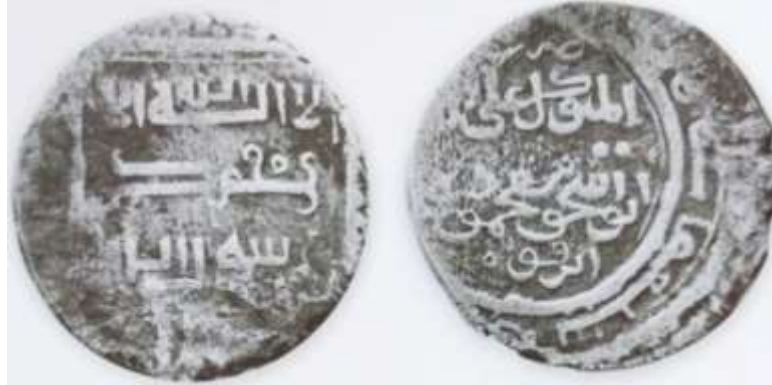
(علاءالدینی، سکه‌های ایران از انقراض ایلخانان مغول تا استیلای تیمور گورکان، ۲۱)