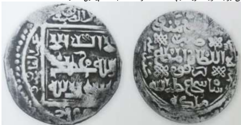
(علاءالدینی، سکه‌های ایران: از انقراض ایلخانان مغول تا استیلای تیمور گورکان، ۱۳۴)

سکه شماره ۳: این سکه ۲/۸۲ گرم وزن و ۲۲/۲ میلی متر قطر دارد. در روی سکه مربعی درون دایره طراحی و نوشته‌ها به خط کوفی تزئینی است: «لا اله الا الله محمد رسول الله». در حاشیه اسامی خلفای راشدین به همراه القاب آن‌ها و عکس جهت حرکت عقربه‌های ساعت نقر شده است: «ابوبکر الصدیق/ عمر الفاروق/ عثمان ذی النورین/ (علی المرتضی)». نوشته‌ها درون یک دایره بزرگ در پشت سکه نقر شده است: «امیرالمؤمنین و/ ضرب/ السلطان المطاع/ ابرقوه/ شاه شجاع خلد الله ملکه». در حاشیه نوشته‌ها و از سمت چپ به راست سال ضرب سکه آمده است: «سنة اثنی و سبعین و سبعمائه». [۷۷۲ق]. چهار نشان حکومتی نیز به صورت قرینه در پشت سکه نقر شده که با سکه پیشین متفاوت است.