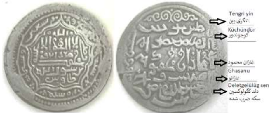
(علاءالدینی، سکه‌های ایران دوره ایلخانان مغول، ۱۲۷)

فلوس ۱ غازانی: از دوره غازان فلوس ضرب طاوس در دست است که ۲/۳۲ گرم وزن و ۲۰ میلی‌متر قطر دارد. بر روی فلوس و درون یک دایره که با نقطه‌چین طراحی شده عبارت «طاوس» دیده می‌شود و این دایره با دو مربع احاطه شده است. به نظر می‌رسد اسامی خلفای راشدین در حاشیه نقر شده باشد. نوشته‌های پشت فلوس هم به خط اویغوری است که با نوشته‌های سکه پیشین یکی است.