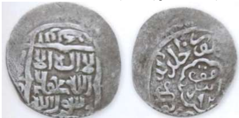
(علاءالدینی، سکه‌های ایران: از انقراض ایلخانان مغول تا استیلای تیمور گورکان، ۱۶۲)

سکه شماره ۵: سکه‌ای از شاه منصور (حک: ۷۹۰-۷۹۵ق)، آخرین پادشاه آل مظفر در دست است که دقت لازم در ضرب ندارد. این سکه ۱/۰۴ گرم وزن و ۱۷/۴ میلی متر قطر دارد. بر روی سکه و درون طرحی مربع شکل، به خط کوفی تزئینی چنین نوشته شده است: «لا اله الا الله محمد رسول الله». دایره‌ای نوشته‌های مرکز سکه را دربرگرفته و در حاشیه اضلاع مربع، اسامی خلفای راشدین عکس جهت حرکت عقربه‌های ساعت نقر شده است: «ابوبکر/عمر/عثمان/علی». در پشت سکه و درون یک طرحی با هشت قوس، محل و سال ضرب سکه آمده است: «ضرب ابرقوه/۷۹۲». به دلیل آسیب دیدگی در حاشیه، فقط عبارت «منصور خلد الله ملکه» را می‌توان مشاهده کرد.