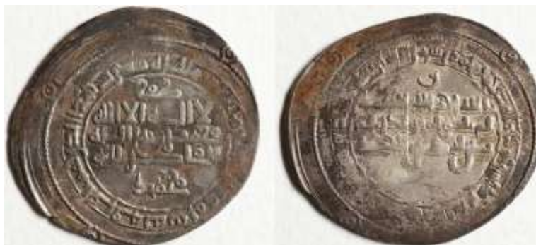
(موزه ملی ملک، شماره سکه ۳۹۴، شماره اموال ۱۴۳).

اطراف خود دارد. طرح روی سکه در پشت سکه نیز تکرار شده است. در مرکز، دایره‌ای قرار دارد که نوشته‌های آن به خط کوفی ساده عبارت‌اند از: «الله احد الله الصمد لم یلد و لم یولد ولم یکن له کفوا احد». در حاشیه علاوه بر «محمد رسول الله»، آیه ۳۳ سوره بقره نقر شده است: «ارسله بالهدی و دین الحق لیظهره علی الدین کله ولو کره المشرکون».