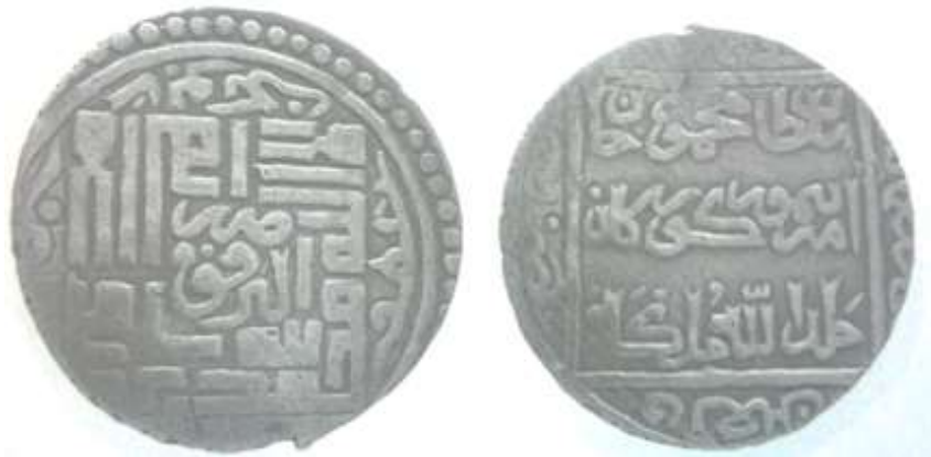
(علاءالدینی، سکه‌های ایران دوره گورکانیان، ۴۷)

بزرگ و تقریباً در مرکز سکه نقره شده و چیش جالبی دارند: «لا اله الا الله/ [به خط ثلث] ضرب ابرقوه/ محمد رسول الله». در حاشیه اسامی خلفای راشدین در مسیر جهت عقربه‌های ساعت حک شده که اسامی «ابوبکر» و «عمر» را می‌توان خواند. نوشته‌ها به خط ثلث در پشت سکه درون یک مربع قرار دارند: «سلطان محمودخان امیر تیمور گورکان خلدالله ملکه». در حاشیه سکه سال ضرب آمده است: «فی شهر/ سنة سبع/ و تسعين/ و سبعمائه» [۷۹۷ق].