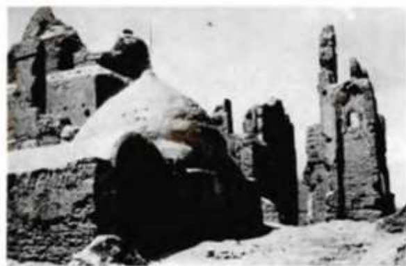
تصویر شماره ۱. مقبره طاوس الحرمین (گدار، آثار ایران، ج ۳، ۴، بخش دوم، ۲۴۰)

سکه‌های ضرب طاوس را معرفی ۱ و فقط در پاورقی اشاره‌ای به دارالضرب کرده است. ۲ با توجه به ضرورت بحث، پژوهش حاضر به دو موضوع مهم که در پژوهش‌های پیشین مورد غفلت واقع شده، پرداخته است: معرفی ابرکوه به‌عنوان جایگاه دارالضرب طاوس و بررسی و تحلیل سکه‌های دارالضرب این شهر که بیش‌تر آن‌ها در مجموعه شخصی ۳ نگه‌داری می‌شوند و تاکنون معرفی نشده‌اند.