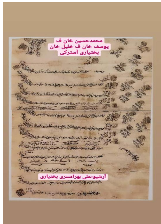
سند شماره ۳