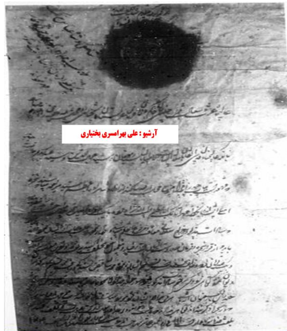
سند شماره ۲

کهن‌ترین فرمانی (سند شماره ۲) که در پیوند با خوانین بختیاری آسترکی برجای مانده است، از سوی شاه صفی (حک: ۱۰۳۸-۱۰۵۲ق) است که در سال ۱۰۴۴ق به نام خلیل خان بختیاری صادر گردیده است و شاه عباس دوم (حک: ۱۰۵۲-۱۰۷۷ق) توشیحی بر آن نگاشته است. ۶