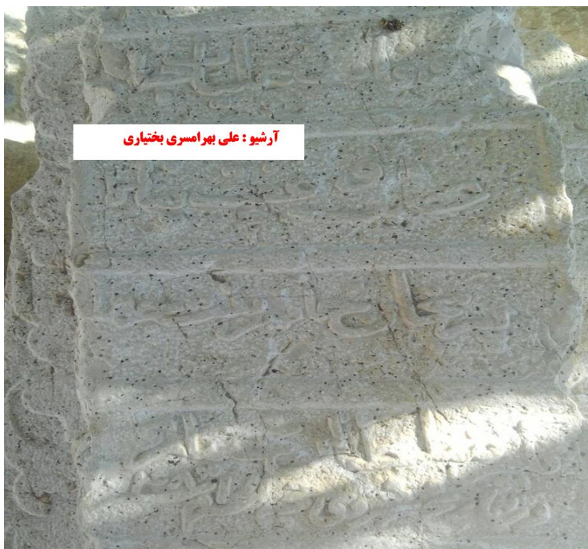
آرامگاه بی بی پریشان خانم دختر امیر جهانگیر خان بختیاری آسترکی

خلیل خان بزرگ، محمدخان، شاه منصورخان، حق نظرخان و نجفقلی بیگ بختیاری آسترکی ترکمان در فهرستی که از فرمانروایان ارائه داده است از خلیل خان پسر جهانگیر خان به عنوان حاکم بختیاری نام می برد. ۱ در سال ۱۰۳۷ق شاه عباس حکومت و امارت تمام سرزمین بختیاری را به خلیل خان پسر امیر جهانگیر خان بختیاری آسترکی واگذار نمود. خلیل خان از مردان بزرگ و امرای مشهور دوران صفویه بود که به لقب خانی و رتبه ایالت و امارت رسید. ۲ در سال ۱۰۳۸ق شاه صفی خلیل خان را به فرمانروایی بختیاری گماشت. ۳ در سال ۱۰۳۹ق سپاهیان عثمانی به همدان تاختند، خلیل خان بختیاری با